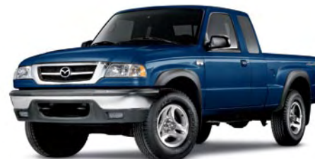
BLEU VISTA MÉTALLISÉ