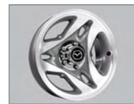
Roues de 16 po en alliage à 3 rayons (SE 4x4)

GARANTIE MAZDA La garantie de base de la camionnette Mazda de série B couvre les pièces contre les défauts de fabrication pendant 3 ans ou 60 000 km, selon la première éventualité. Des garanties supplémentaires couvrent les composants du groupe motopropulseur pendant 5 ans ou 100 000 km, selon la première éventualité, la perforation des panneaux de carrosserie due à la corrosion pendant 5 ans sans limite de kilométrage, ainsi que des composants spécifiques du système antipollution pendant une période pouvant aller jusqu'à 8 ans ou 128 000 km. Sont exclus de la garantie les éléments et réglages relevant de l'entretien (réparations n'exigeant pas de pièce de rechange) pour les véhicules vendus depuis plus de 12 mois, ainsi que les réparations rendues nécessaires à la suite d'une usure normale. Pour de plus amples renseignements, voyez votre concessionnaire Mazda.