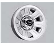
Roues de 15 po en acier argent à 7 rayons (cabine simple)