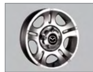
Roues de 15 po en alliage à 5 rayons (SX à cabine allongée)