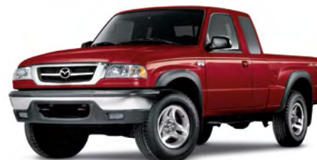
ROUGE FEU MÉTALLISÉ