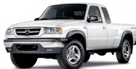
TITANE FONCÉ MÉTALLISÉ