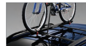
Porte-bicyclettes pour porte-bagages de toit