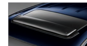
Déflecteur de toit ouvrant