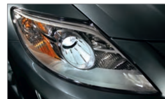
Phares à fonctionnement automatique au xénon à décharge à haute intensité