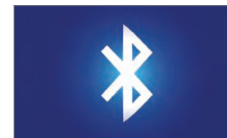
Fonction d'intégration de téléphone cellulaire mains libres Bluetooth MD