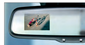
Caméra de marche arrière avec affichage au rétroviseur auto-atténuant