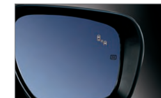
Système de surveillance des angles morts