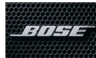
Système audio Bose MD à sonorité ambiophonique Centerpoint MD